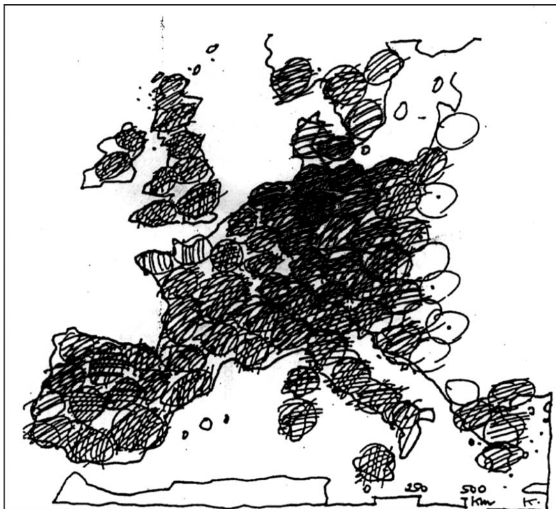
Carte 1 : La grappe de raisins (d'après K.R. Kunzmann, art. cité)